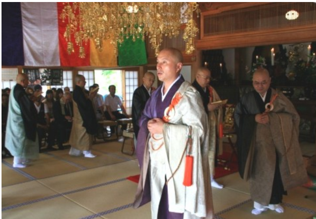
住職を先頭にお経を唱えながら本堂を廻ります。