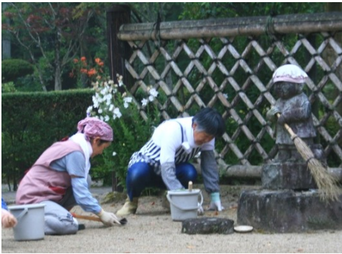
前日早朝の草取り

結びに、檀信徒皆様の益々の御繁栄を御祈念申し上げ、私の発足にあたっての御挨拶とさせていただきます。