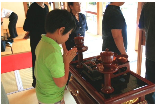
手を合わせ先祖の霊を弔います。