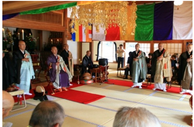
和尚さん大集合 いよいよ儀式が始まります。