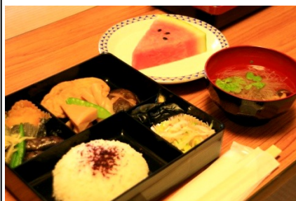
女性部による精進料理 おいしく頂きました。