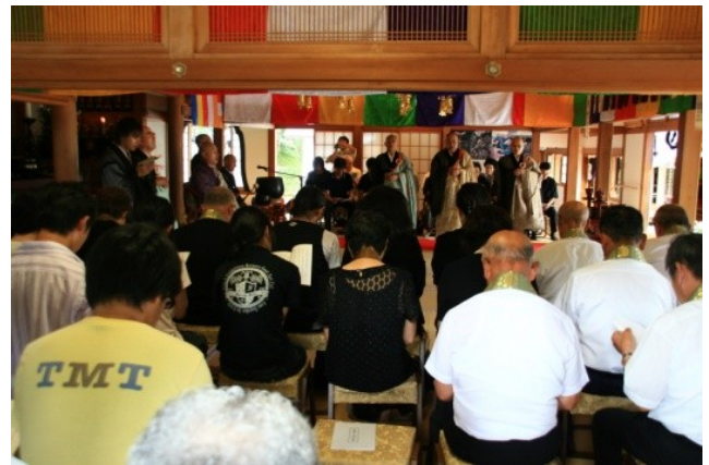
みんなで般若心経をあげています。