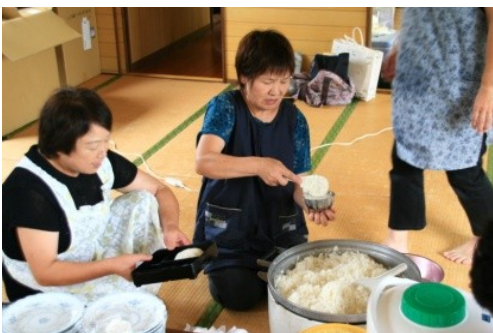
公民館で精進料理に大奮闘