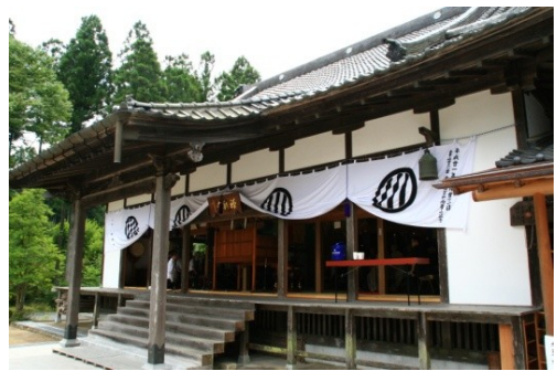
本堂に幕が張られ 準備万端