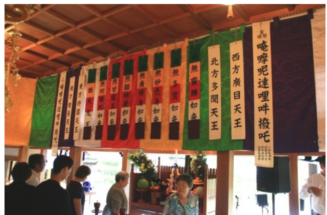
壁には仏さまの名前を記した幡がいっぱい